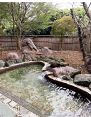
天然温泉の露天風呂。成分はナトリウム泉で効能は美肌。プレーの疲れが癒される

「まだ2台ですが、導入にあたってはカメラを搭載した組だけではなく数組のコンペのショットを撮影できるようにしたり、様々な要望を頂きました。自分のコースでのスイング映像は中 く、1日楽しかったという想い出を持ち帰ってもらいたい」と専務は語る。業界初のサービスのため先行者利益として、話題性が高まることを期待しており、プロなどがレッスン用として利用するなど、今後様々な活用方法を期待しているという。 同クラブは現在、室井専務が現場を総指揮