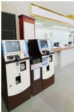
自動精算機2台。フロントにはふるさと納税受付タブレット

万人弱ほどでインターからの距離が遠さを感じるギリギリと自覚しており、料金競争に巻き込まれない施策を目指している。 メンバーの居住比率は都内、埼玉と千葉、県内が各3分の1で、ビジターの来場比率が高いことからサービス面での差別化が必要になる。もっとも会員数の少なさから今年1月から開場35周年記念として一代会員を16万5000円（年会費3・3万円）で35名限定の募集を開始した。定員に達し次第募集終了とのことだ。