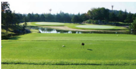
池越えの名物15番P3。バントとバミューダの2グリーンで酷暑でも芝の心配なくなった

「夏場に芝がやられてしまうと、2〜3割のお客様が来なくなる。毎年暑い中で対策を迫られるなら、何か手を打とう」と専務は語る。そこで導入したのが、暖地型芝であるバミューダグラス、中でも「チャンピオンドワーフ」という品種だ。管理を委託