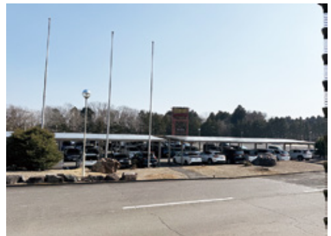
駐車場の屋根にはソーラーパネル

クラブハウスはバブル期に建設された広大な施設で管理面では負担も多いというが、利便性も考え、例えばフロントに設置したふるさと納税受付のタブレットや自動精算機の手続き等でお客が不明の点があれば事務所の