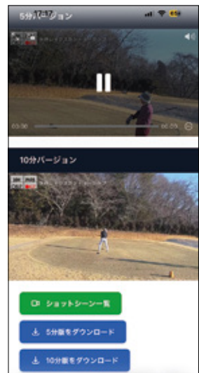
プレー自動撮影サービス「GoodSpot」の提供画面