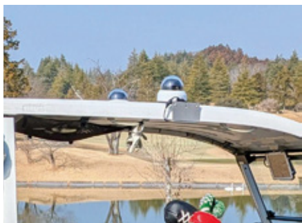
カート屋根部分にカメラ2台設置（業界初のプレー自動撮影サービス）

「まだ2台ですが、導入にあたってはカメラを搭載した組だけではなく数組のコンペのショットを撮影できるようにしたり、様々な要望を頂きました。自分のコースでのスイング映像は中