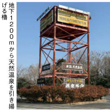
地下1200mから天然温泉を引き揚げる槽

その後、預託金問題の解決が急務となり、2010年には社長として民事再生法申請の重責を