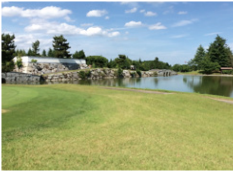
城壁のように見える同クラブ名物の横断橋

している専門業者のアドバイスを受けながら、2グリーン的一方をバミューダ化する改修をここ2年かけて実施した。 これにより、猛暑の夏場でも「芝の心配が半減する」だけでなく、短く刈り込めるためスピードも出せ、コンディションを維持できるようにした。現在、この品種の導入としては「ここが北限（一番北）」と言われており、他場のキーパーが視察に訪れる注目を集めている。 また人手不足対策やコースコンディション向上を目的に、今春には無人乗用芝刈り機の導入